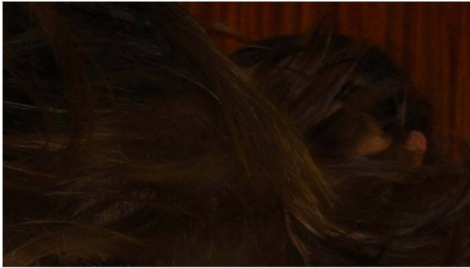
« Le temps d'une chevelure entre Brunette et Châtaigne »